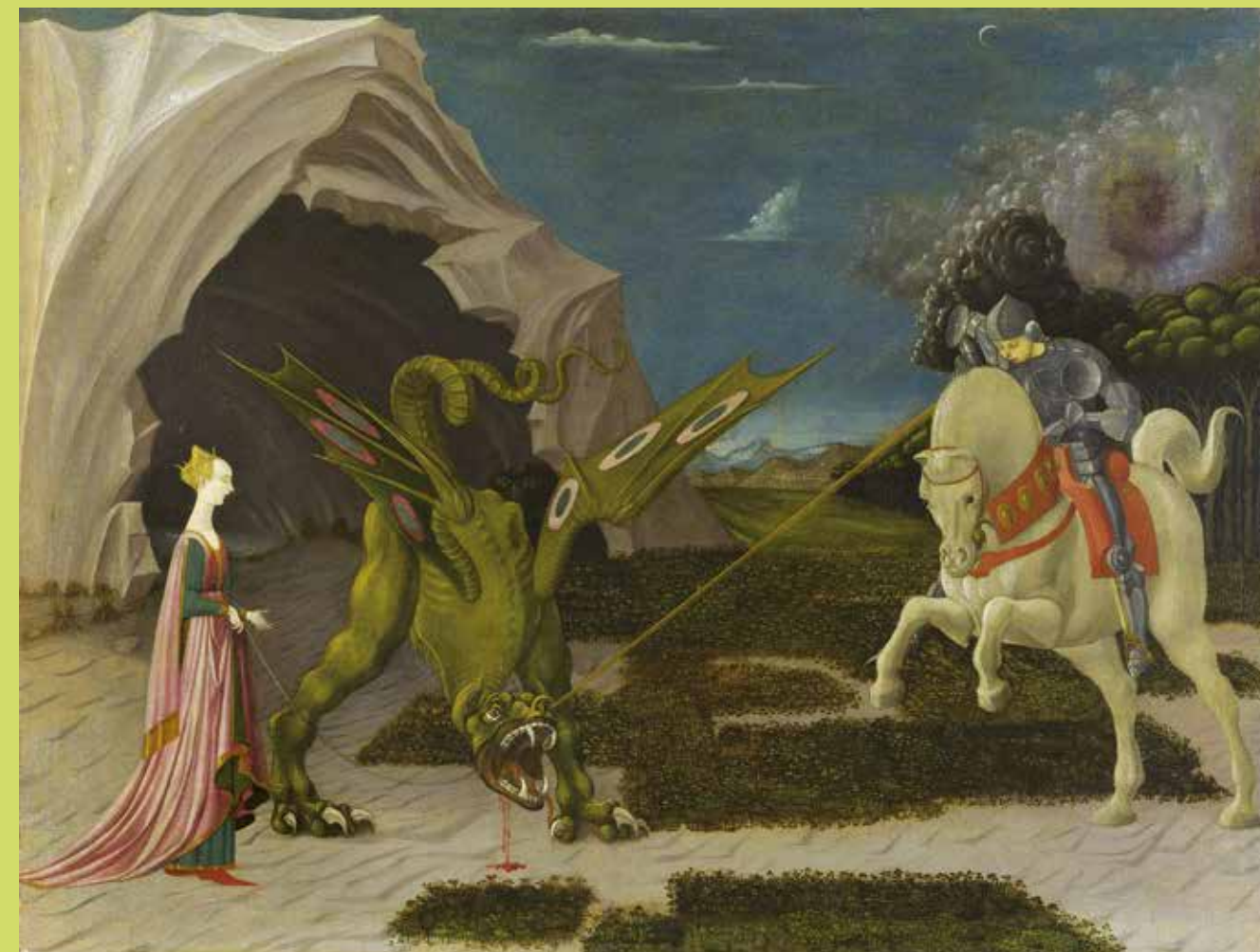
Paolo Uccello, Saint Georges et le dragon , 1470. LONDRES, NATIONAL GALLERY