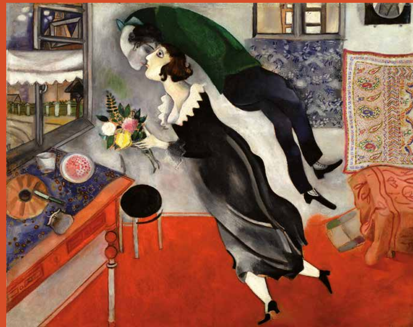
Marc Chagall, Anniversaire, 1915. NEW YORK, THE MUSEUM OF MODERN ART