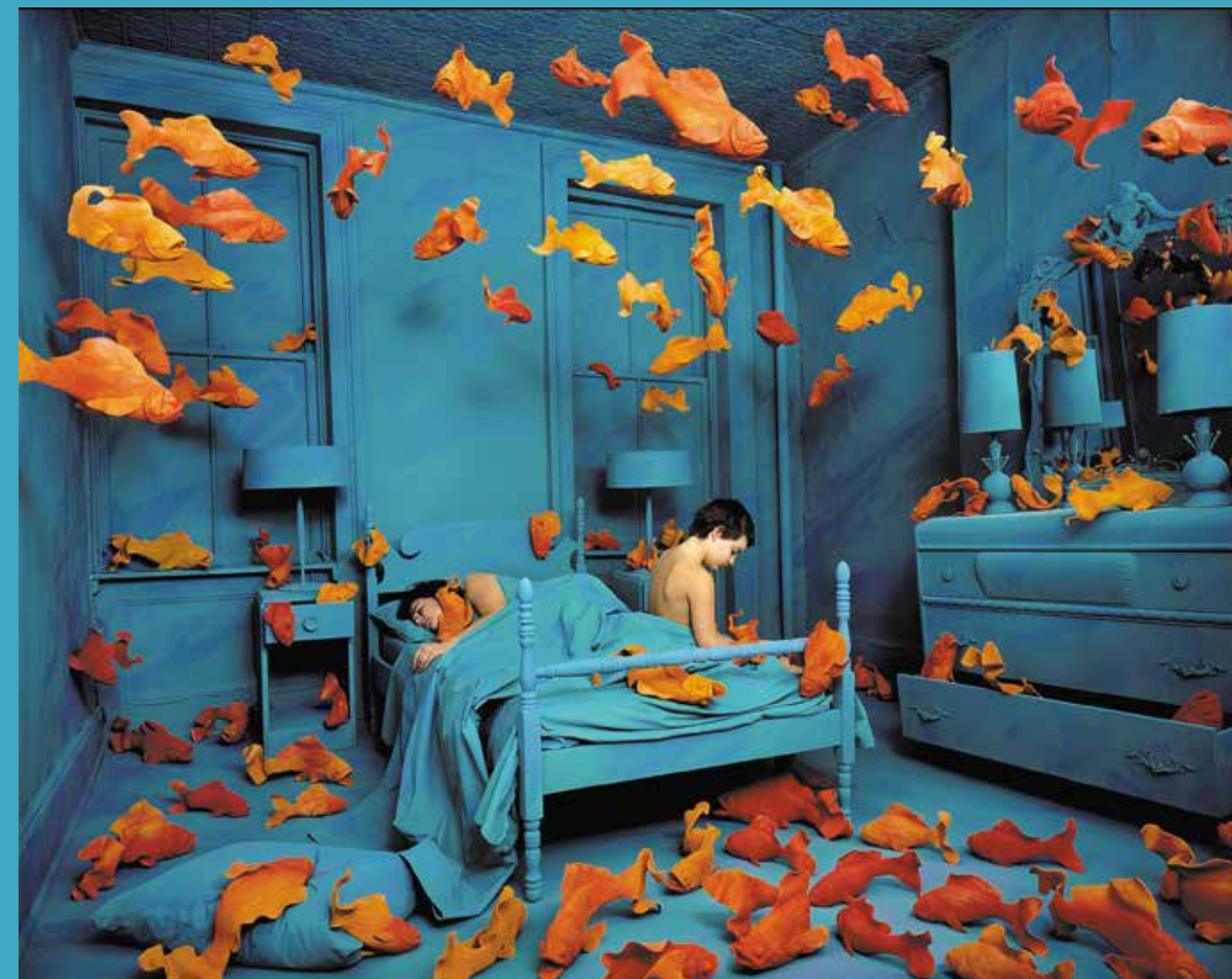
Sandy Skoglund, Revenge of the Goldfishes, 1981.